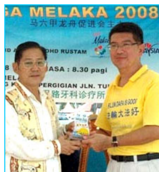
▲主办方给参赛的法轮功学员代表（右）颁奖

【明慧网】马来西亚“马六甲龙舟金杯锦标赛”于二零零八年六月一日在马六甲河畔举行，当地法轮功学员组成女子队和男子队参加了这项传统文化活动，并分别获得精神奖和纪念奖。主办单位特别安排新加坡法轮功学员组成的腰鼓队表演中华传统腰鼓舞，令龙舟赛更添欢乐气氛。