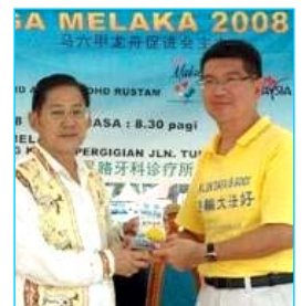
▲主办方给参赛的法轮功学员代表（右）颁奖

在龙舟赛过程中，很多民众了解到法轮大法洪传世界八十多个国家和在中国无辜被迫害的真相。人们纷纷签名，呼吁立即制止中共对法轮功的迫害。马六甲州首席部长也前来了解法轮功，他在离开前不忘带走一份真相资料。其他