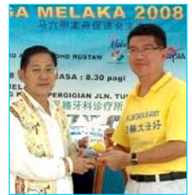
▲主办方给参赛的法轮功学员代表（右）颁奖

在龙舟赛过程中，很多民众了解到法轮大法洪传世界八十多个国家和在中国无辜被迫害的真相。人们纷纷签名，呼吁立即制止中共对法轮功的迫害。马六甲州首席部长也前来了解法轮功，他在离开前不忘带走一份真相资料。其他