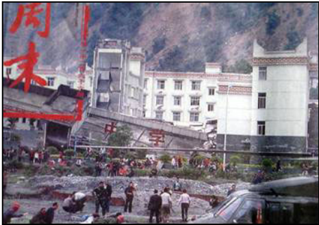
倒塌的中学后面露出坚固豪华的办公楼

中共一方面利用其喉舌媒体栽赃法轮功，一方面封锁网络，不准大陆民众上网阅读法轮功的书籍，再一方面对