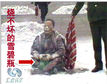
中共曾导演自焚伪案，煽动民众仇恨，为迫害法轮功制造借口

在大陆自费印制、散发真相传单的 法轮功修炼者进行绑架、抄家、酷刑逼供、非法判刑。这种剥夺民众知情权和发言权的一言堂，只能让人看到中共的做贼心虚。