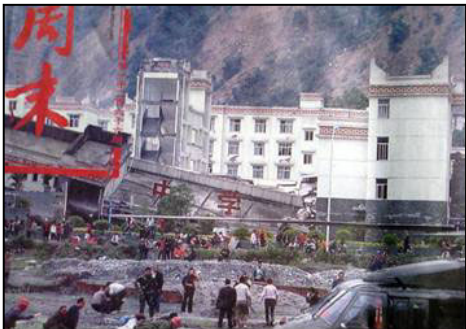
倒塌的中学后面露出坚固豪华的办公楼

中共一方面利用其喉舌媒体栽赃法轮功，一方面封锁网络，不准大陆民众上网阅读法轮功的书籍，再一方面对