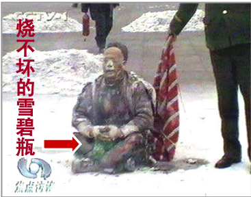
中共曾导演自焚伪案，煽动民众仇恨，为迫害法轮功制造借口

在大陆自费印制、散发真相传单的 法轮功修炼者进行绑架、抄家、酷刑逼供、非法判刑。这种剥夺民众知情权和发言权的一言堂，只能让人看到中共的做贼心虚。