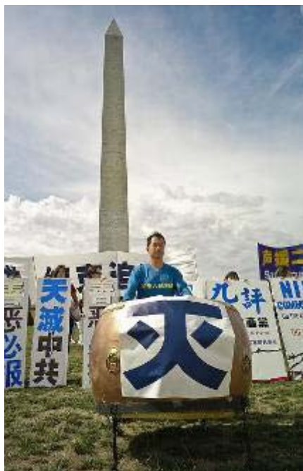
退党集会一贯打鼓 寓意镇邪灭乱

吉祥平安鼓、丰收鼓还有战鼓，宫廷有宫廷的鼓，如皮鼓等，民间有民间的鼓，如腰鼓最为常见。总之，鼓的种类繁多，在民间的运用随处可见。