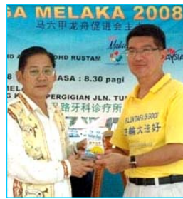
▲主办方给参赛的法轮功学员代表(右)颁奖

在龙舟赛过程中，很多民众了解到法轮大法洪传世界八十多个国家和在中国无辜被迫害的真相。人们纷纷签名，呼吁立即制止中共对法轮功的迫害。马六甲州首席部长也前来了解法轮功，他在离开前不忘带走一份真相资料。其他参加龙舟赛的成员也感受到大法的美好，他们在法轮功学员代表领奖时，齐声高喊“法轮大法好”。