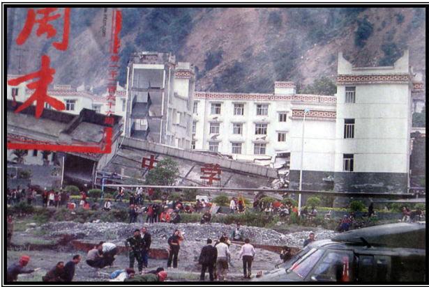
倒塌的中学后面露出坚固豪华的办公楼

【明慧网】5月21日，洛杉矶部分法轮功学员和支持者在中共领事馆前集会，谴责中共利用其在海外的特务机构，攻击法轮功学员以及参加声援中国民众退党集会的华人。