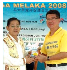
▲主办方给参赛的法轮功学员代表（右）颁奖

在龙舟赛过程中，很多民众了解到法轮大法洪传世界八十多个国家和在中国无辜被迫害的真相。人们纷纷签名，呼吁立即制止中共对法轮功的迫害。马六甲州首席部长也前来了解法轮功，