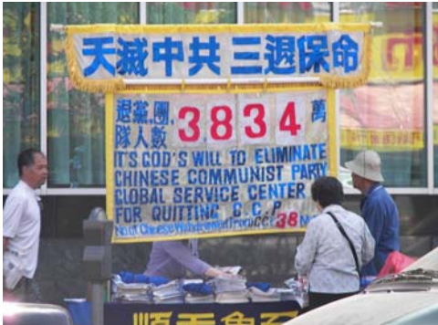
在法拉盛的退党点日益成为法拉盛的一部份。

这条新闻内销大陆，就摇身一变，将法轮功学员事先向纽约警察局申请好的退党集会(受美国法律保护)，变成“纽约华人为四川震灾募捐”，把被中共使馆在背后策动前来围攻法拉盛退党集会的肇事者，谎称为“为四川震灾募捐”。节目内容与视频画面明显不符合。在中共媒体广泛刊登的攻击法轮功学员的视频节目的画面中，出现“退党保命”等退党集会的横幅等，也证