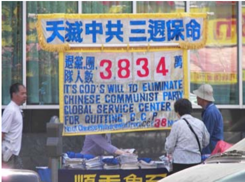
在法拉盛的退党点日益成为法拉盛的一部份。

这条新闻内销大陆，就摇身一变，将法轮功学员事先向纽约警察局申请好的退党集会(受美国法律保护)，变成“纽约华人为四川震灾募捐”，把被中共使馆在背后策动前来围攻法拉盛退党集会的肇事者，谎称为“为四川震灾募捐”。节目内容与视频画面明显不符合。在中共媒体广泛刊登的攻击法轮功学员的视频节目的画面中，出现“退党保命”等退党集会的横幅等，也证