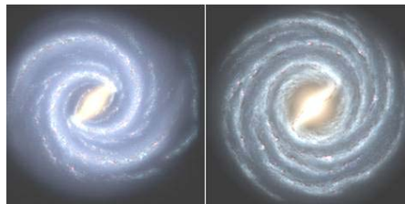
左边是银河系的目前结构 右边是较早的银河系图像

负责此项目的威斯康星州大学研究员罗伯特·本杰明及其同事利用恒星统计方法，注意到长形盾-半人马座臂膀方向的恒星数量在增加，而人马座和矩尺座臂膀方向的恒星在减少。本杰明在6月4日举行的美国天文学学会大会上发表了其小组的研究结果。