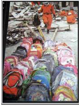
▲在学校废墟中收集的中小學生书包,待父母认领。