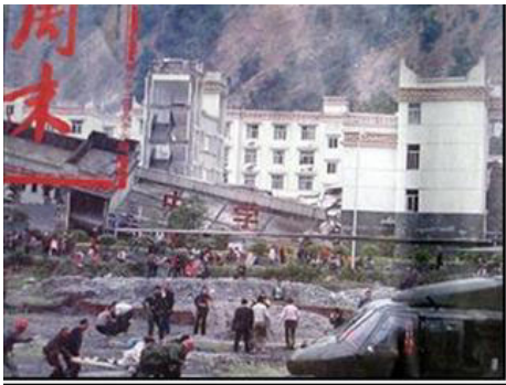
▲老旧灰暗的中学教学楼倒塌了，后面露出光亮气派的办公楼（四川省汶川县）。

了一座光亮，气派的办公楼，不但没有被震倒、震塌，墙上几乎都看不到裂纹。这说明政府办公楼是多么的牢固。