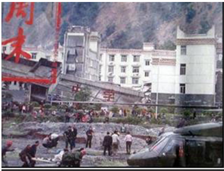
▲老旧灰暗的中学教学楼倒塌了，后面露出光亮气派的办公楼（四川省汶川县）。

了一座光亮，气派的办公楼，不但没有被震倒、震塌，墙上几乎都看不到裂纹。这说明政府办公楼是多么的牢固。