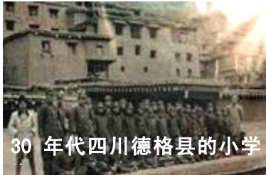
30 年代四川德格县的小学