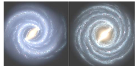
左边是银河系的目前结构 右边是较早的银河系图像

据美国太空网日前报导，几十年来，天文学家描绘的银河系有四条主要盘旋“臂膀”（就是现在的矩尺座、长形盾-半人马座、人马座和伯尔修斯），然而新图像显示，银河系目前只剩下两条主臂。