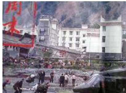
图：倒塌的中学后面是政府坚固豪华的办公楼

大地震发生时，72 小时特别是 24 小时之内，是救人的黄金时期。但是共产党尽管在宣传上显得非常迅速、积极的救援灾民，但是却迟迟的不进入震中地区，坐失最佳的救援时机，许多人民的生命就这样失去了。根据