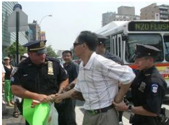
美国警察逮捕谩骂法轮功学员的中共暴徒。