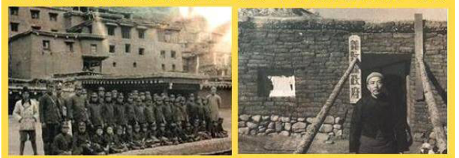
30年代四川的德格县的小学（左）和义敦县县政府（右）

孙明经在考察中发现，当年的学校一般来说都有比较好的校舍，学生也比较整齐。反而一些县政府的办公室破破烂烂。于是，孙先生就问一个县长：“为什么县政府的房子总是不如学校？”这个县长回答：