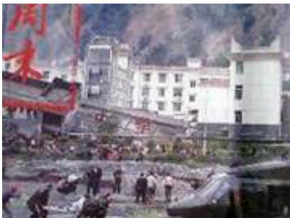
倒塌的中学后面是政府坚固豪华的办公楼（汶川县）

大地震中，大部份校舍倒塌，砸死了许多孩子。不管是老校舍还是新校舍，都在地震中倒了。而中共的办公大楼很少像学校那样倒塌的。十几年前，克拉玛依发生火灾，