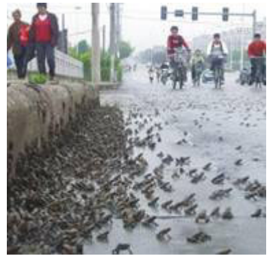
《华西都市报》2008年5月10日报导绵竹市西南镇出现了大规模的蟾蜍迁徙。

这次汶川大地震，并不是没有专业和非专业人员的预报，但是被共产党为了保证“奥运”的所谓“稳定”、“和谐”气氛而给压制、隐瞒了起来。2年前就有专业的地震研究人员预报了2008年四川西部地区要发生大地震，而半年来直到半个月前仍然有专业地震研究人员发出了川西即将发生地震的预警。同样还有非专业人员在地震前发出了预告。但是这些预报都被共产党给隐瞒封锁了。