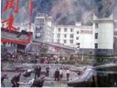
倒塌的中学后面是政府坚固豪华的办公楼（汶川县）

大地震中，大部份校舍倒塌，砸死了许多孩子。不管是老校舍还是新校舍，都在地震中倒了。而中共的办公大楼很少像学校那样倒塌的。十几年前，克拉玛依发生火灾，