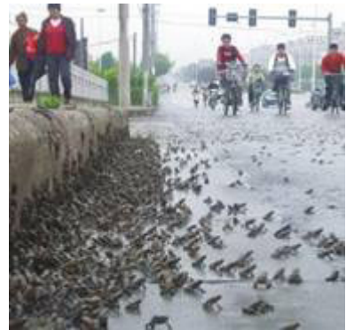
《华西都市报》2008年5月10日报导绵竹市西南镇出现了大规模的蟾蜍迁徙。

这次汶川大地震，并不是没有专业和非专业人员的预报，但是被共产党为了保证“奥运”的所谓“稳定”、“和谐”气氛而给压制、隐瞒了起来。2年前就有专业的地震研究人员预报了2008年四川西部地区要发生大地震，而半年来直到半个月前仍然有专业地震研究人员发出了川西即将发生地震的预警。同样还有非专业人员在地震前发出了预告。但是这些预报都被共产党给隐瞒封锁了。