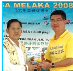
主办方给法轮功学员代表（右）颁奖

【明慧网】“马六甲龙舟金杯锦标赛”六月一日在马来西亚马六甲河畔举行，当地法轮功学员组成的女子和男子队分别获精神奖和纪念奖。主办单位特别安排新加坡法轮功学员组成的腰鼓队前来表演，令龙舟赛更添欢乐气氛。