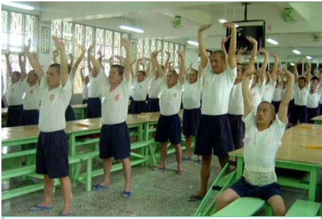
台湾多家监狱把学炼法轮功纳入教化课程。图为服刑人在炼功。

后来的时间他坚持炼功学法，慢慢的去除了心毒，静心修炼法轮功。被毒品侵蚀了几十年的身体开始不断的净化，精神慢慢的好起来了，体力也跟着恢复了。这时他向监狱里的朋友宣布，从今以后跟毒品绝缘了。