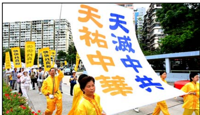
大游行的主题是“天灭中共，天佑中华”

图片说明:2008年6月15日,香港举行声援3800万勇士退出中共的集会游行,退党集会活动在正午12时,在九龙长沙湾游乐场举行,多位社会知名人士出席声援。集会结束后,5百多人的游行队伍沿着九龙繁华的街道前往尖沙