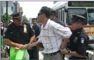
纽约警方逮捕漫骂法轮功学员的中共暴徒

但是在民主法制社会里，中共的谎言和暴力没有市场。“法拉盛暴力事件”已日益引起美国和全世界的广泛关注，上百名联邦议员、国务院、联邦调查局、国土安