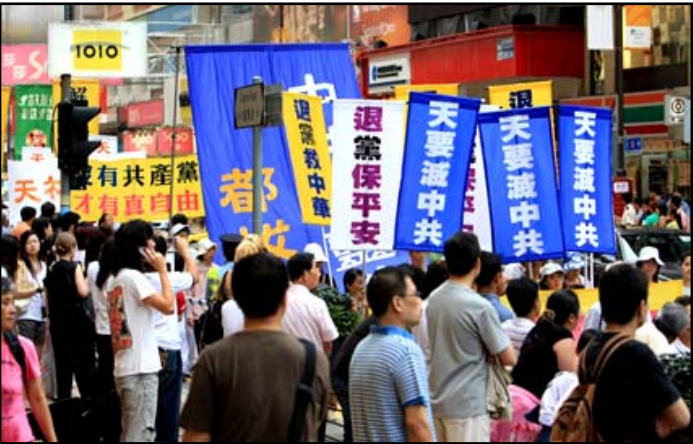
街道两旁站满观看游行的市民与游客

此次游行规模盛大，队伍的主题是“法轮大法好”，有六大方阵组成，除主题方阵外的五大方阵分别为：天国乐队方阵、法轮大法介绍方阵、法轮大法洪传方阵、法轮功反迫害方阵及九评退党方阵。