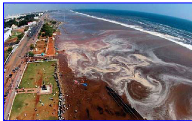
2004年印度洋海啸，30多万人丧生。海啸来临前，很多游客认为当地人的提醒扫了他们游玩的兴致。

村口有个老太太正在给佛上香，老太太说：“就这一碗饭了，给你半碗吧，留下半碗还得给佛上供呢。”地藏菩萨一看老太太心地善良，临行时就指着村口的一对儿石狮子对她说：“什么时候这对儿狮子的眼睛红了，就是要发大水了，你就赶快往山上跑，保你平安。”善良的老太太马上把这消息告诉了乡