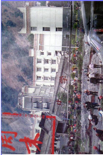
倒塌的中学后面露出了坚固豪华的办公楼