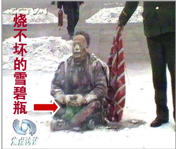
中共导演“自焚伪案”，煽动民众仇恨，为迫害法轮功制造借口

只有了解能化解误解。古语说：“兼听则明，偏听则暗。”真相能揭开谜团，为我们辨别方向。所以，不要关上这扇通往光明的真相之门。如果文革中被迫害的人都能站起来，澄清事实真相，那么你死我活的斗争悲剧就不会发生。如果今天我们能倾听法轮大法真相，就会明辨是非；大家都来传播真相，揭露邪恶就能制止迫害，为我们自己选择美好的未来。