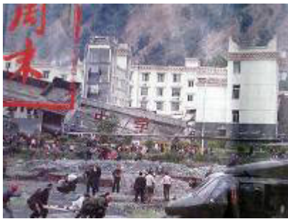
图：倒塌的中学后面是政府坚固豪华的办公楼

不管是老校舍还是新校舍，都在地震中倒了。而中共官员很少有死的，中共的办公大楼很少像学校那样倒塌的。十几年前，克拉玛依发生火灾，“让领导先走”的命令使得几百个孩子被烧死、