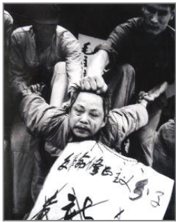
“文革”中典型的 百姓斗百姓的场面

这个笑话反映出—个社会现实：误解的产生主要是由于我们对事物真相并不清楚，又听信谣言，或者被错误的宣传所蒙骗，或者固步自封、盲从下断言所导致。个人的误解伤害的是周围的人们，而政府的谎言宣传伤害的是国家的所有人民。独裁暴君希特勒曾经说过“民众不思考就是政府的福气”。相信谎言、盲从斗争的人们，就成了暴政利用的对象。