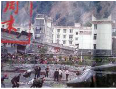
图：倒塌的中学后面是政府坚固豪华的办公楼

闷死，而领导们全逃脱了。现在中共依然是榨取人民的血汗，自己住和办公在豪华的房子里。共产党的唯一目的就是维持自己的统治，采用的是一贯的谎言和暴力的方式。尽管目前共产党表面上也做出积极救灾的姿态，在媒体上拼命宣传自己救灾的形象，但是揭开共产党的画皮，共产党漠视人民生命的邪恶本质就彻底地暴露出来了。