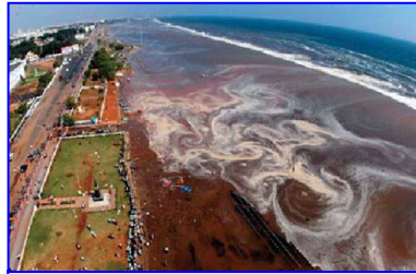
2004年印度洋海啸，30多万人丧生。海啸来临前，很多游客认为当地人的提醒扫了他们游玩的兴致。

村口有个老太太正在给佛上香，老太太说：“就这一碗饭了，给你半碗吧，留下半碗还得给佛上供呢。”地藏菩萨一看老太太心地善良，临行时就指着村口的一对儿石狮子对她说：“什么