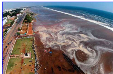
2004年印度洋海啸，30多万人丧生。海啸来临前，很多游客认为当地人的提醒扫了他们游玩的兴致。

村口有个老太太正在给佛上香，老太太说：“就这一碗饭了，给你半碗吧，留下半碗还得给佛上供呢。”地藏菩萨一看老太太心地善良，临行时就指着村口的一对儿石狮子对她说：“什么