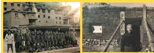
30年代四川的德格县的小学（左）和义敦县县政府（右）

过去我认为只要自己无视窗外事，就能平安过日子了。然而汶川地震给我敲醒了警钟，一个漠视生命的政权