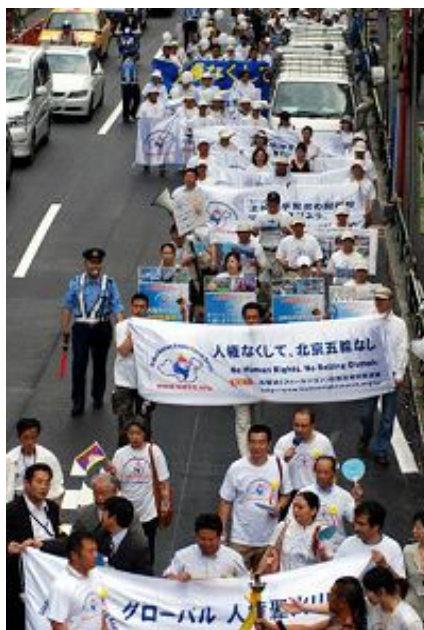
穿越东京闹市的人权圣火传递接力，引起路人关注

当天的传递活动主要分为两部份，第一部中午十二点半开始到下午三点半举行人权圣火传递仪式、接力跑活动及东京到长野的圣火交接仪式。第二部份下午五点半开始到晚上八点结束，活动包括人权圣火野外音乐会和烛光追悼会。人权圣火传递仪式从十二点三十分在代代木公园野外音乐台举行。在点火仪式前，由各方来宾到场发言致意。