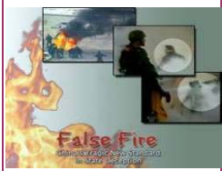
揭露自焚的影片《伪火》获第 51 届哥伦比亚国际电影节荣誉奖。

法轮功人是共产党镇压的对象。他们上访也好，发传单也好，挂条幅也好，无非是想说一句话，“法轮功不是邪教”。这就是事实，这就是真相，一点都不玄的。对于这一点，法轮功人像神明一样清楚，共产党也像幽灵一样明白。所有的中国人都不敢说自己一点也不知道这件事情。过去，毛泽东手大能遮住天，现在，江泽民遮不住天了。