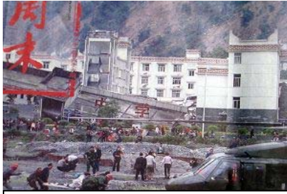
倒塌的中学后面露出了坚固豪华的办公楼

此次震灾中，仅都江堰一地三所学校就有超过1200多名学生遇难，据都江堰政府公布的数据，截至5月22日，新建小学在此次地震中有243名学生遇