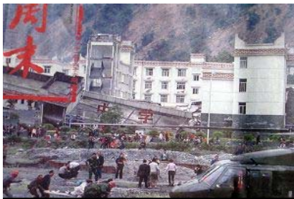
倒塌的中学后面露出了坚固豪华的办公楼

此次震灾中，仅都江堰一地三所学校就有超过1200多名学生遇难，据都江堰政府公布的数据，截至5月22日，新建小学在此次地震中有243名学生遇