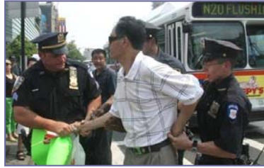
纽约警方逮捕谩骂法轮功学员的中共暴徒

但是在民主法制社会里，中共的谎言和暴力没有市场。“法拉盛暴力事件”已日益引起美国和全世界的广泛关注，上百名联邦议员、国务院、联邦调查局、国土安全部，都在关注、调查此事，十多位政要谴责中共的文革式暴力。人们更通过法轮功学员在逆境中慈悲、祥和的表现，看到了正与邪、善与恶的鲜明对照，看清了中共对中国人民、对国际社会的巨大危害。