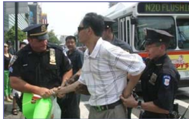
纽约警方逮捕谩骂法轮功学员的中共暴徒

但是在民主法制社会里，中共的谎言和暴力没有市场。“法拉盛暴力事件”已日益引起美国和全世界的广泛关注，上百名联邦议员、国务院、联邦调查局、国土安全部，都在关注、调查此事，十多位政要谴责中共的文革式暴力。人们更通过法轮功学员在逆境中慈悲、祥和的表现，看到了正与邪、善与恶的鲜明对照，看清了中共对中国人民、对国际社会的巨大危害。