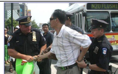
纽约警方逮捕谩骂法轮功学员的中共暴徒

但是在民主法制社会里，中共的谎言和暴力没有市场。“法拉盛暴力事件”已日益引起美国和全世界的广泛关注，上百名联邦议员、国务院、联邦调查局、国土安