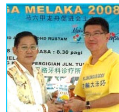
主办方给法轮功学员代表（右）颁奖

【明慧网】“马六甲龙舟金杯锦标赛”六月一日在马来西亚马六甲河畔举行，当地法轮功学员组成的女子和男子队分别获精神奖和纪念奖。主办单位特别安排新加坡法轮功学员组成的腰鼓队前来表演，令龙舟赛更添欢乐气氛。