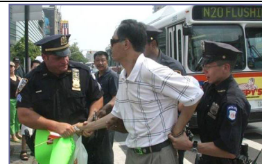
纽约警方逮捕谩骂法轮功学员的中共暴徒

但是在民主法制社会里，中共的谎言和暴力没有市场。“法拉盛暴力事件”已日益引起美国和全世界的广泛关注，上百名联邦议员、国务院、联邦调查局、国土安