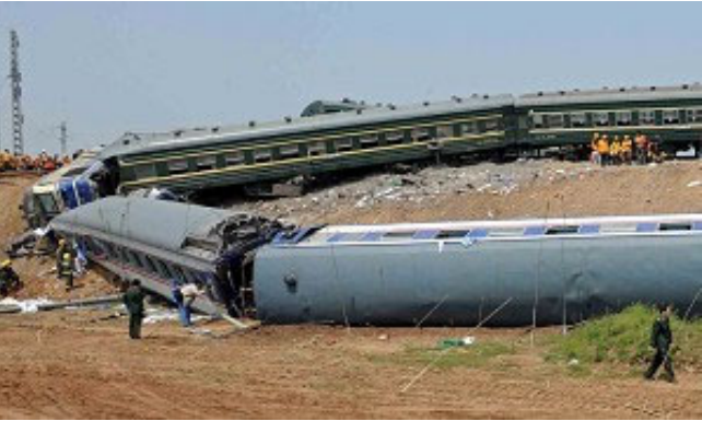
列车相撞后，造成九节车厢脱轨，其中七、八节车厢翻到路基下。

将我们送到了淄博车站。 回来后，我把此事告诉二儿子，儿子在电话中激动的说：“娘，你确实感到大法的神奇了吧？是大法师父救了我娘和哥！”我说：“确实是。”二儿子早已明白真相并退出了邪党。 老头子听我讲了当时的经过，不停的说：“哎呀，师父啊，师父，多亏您救了老伴和我儿子啊！”他对师父真是千恩万谢。 再次感谢伟大的师尊救了我与儿子及全家人！常念“法轮大法好”老人得福报。