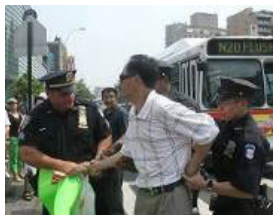
美国警察逮捕谩骂法轮功学员的中共暴徒。

法拉盛事件已经得到美国上百名联邦参议员、众议员办公室，国务院、联邦调查局、国土安全部等的关注和调查，十多位政要谴责文革式的黑色暴力，并表示这样的攻击损害了美国的立国精神：自由和人权。