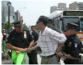
美国警察逮捕谩骂法轮功学员的中共暴徒。

法拉盛事件已经得到美国上百名联邦参议员、众议员办公室，国务院、联邦调查局、国土安全部等的关注和调查，十多位政要谴责文革式的黑色暴力，并表示这样的攻击损害了美国的立国精神：自由和人权。