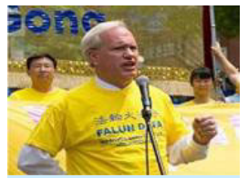
纽约市议员托尼·艾瓦拉穿着印着“法轮大法好”的黄色T恤呼吁保护法轮功学员的基本人权。