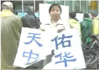
「纽约退党中心」的义工，她手中的「天佑中华」的标语牌被中共收买的暴徒撕毁。

对这些阴谋的策划，中共驻纽约总领事彭克玉，在一个电话中承认中领馆确实参与和策动了最近发生的在纽约法拉盛的围攻退党中心义工事件。“追查