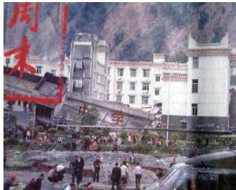
▲ 中学教学楼倒塌了，后面露出光亮气派的办公楼（四川汶川县）