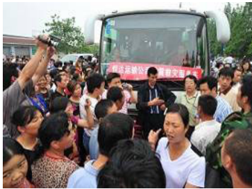
▲ 在地震中失去孩子的家长集体抗议，要求调查豆腐渣工程。

2008 年 4 月 26 日和 27 日，中国地球物理学会下属的“天灾预测委员会”集体讨论，也作出了预报，并将文字报告于 4 月 30 日上报中国地震局。英国等地科学家在 5 月 9 日就已经把将可能会发生大地震的消息发给中共当局。