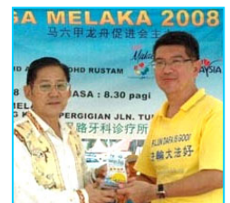
主办方给法轮功学员代表（右）颁奖

【明慧网】“马六甲龙舟金杯锦标赛”六月一日在马来西亚马六甲河畔举行，当地法轮功学员组成的女子和男子队分别获精神奖和纪念奖。主办单位特别安排新加坡法轮功学员组成的腰鼓队前来表演，令龙舟赛更添欢乐气氛。