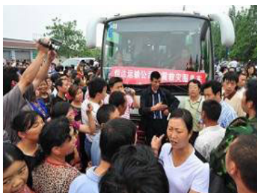
▲ 在地震中失去孩子的家长集体抗议，要求调查豆腐渣工程。

2008 年 4 月 26 日和 27 日，中国地球物理学会下属的“天灾预测委员会”集体讨论，也作出了预报，并将文字报告于 4 月 30 日上报中国地震局。英国等地科学家在 5 月 9 日就已经把将可能会发生大地震的消息发给中共当局。