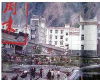
▲ 中学教学楼倒塌了，后面露出光亮气派的办公楼（四川汶川县）