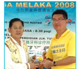
主办方给法轮功学员代表（右）颁奖

【明慧网】“马六甲龙舟金杯锦标赛”六月一日在马来西亚马六甲河畔举行，当地法轮功学员组成的女子和男子队分别获精神奖和纪念奖。主办单位特别安排新加坡法轮功学员组成的腰鼓队前来表演，令龙舟赛更添欢乐气氛。