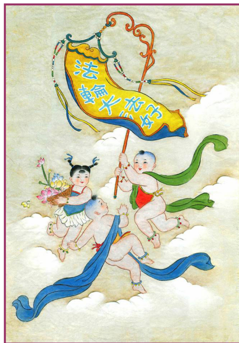
工笔画：喜娃娃，作者：云子

中华民族是否拥有好的未来，这不取决于中共，而取决于中国人自己的选择。不妨说，目前一部分中国人生活境遇的改善，是中国人自己造成的，如果非要说与中共有什么相干，那就是中共失去了对中国人的绝对控制所致。说到底，信仰真善忍无罪，这个世界多一份“真善忍”，就少一份“假恶暴”。假恶暴的横行对任何地区、任何社会都是致命的毒害。法轮功有没有受到中共的迫害，这才是人们应该关注的；如何帮助法轮功去制止这场迫害，才是有良知的人们应该去做的。而理解不理解法轮功的理论并不重要，修炼的理本来就不是大众化的，只有真修者才能理解修炼的内涵。