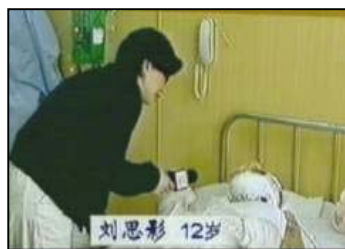
气管切开还能说唱?记者采访不穿防护服,不戴口罩?