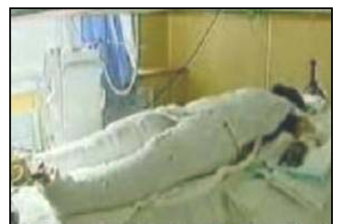
《焦点访谈》中的“自焚者”被包裹得严密。