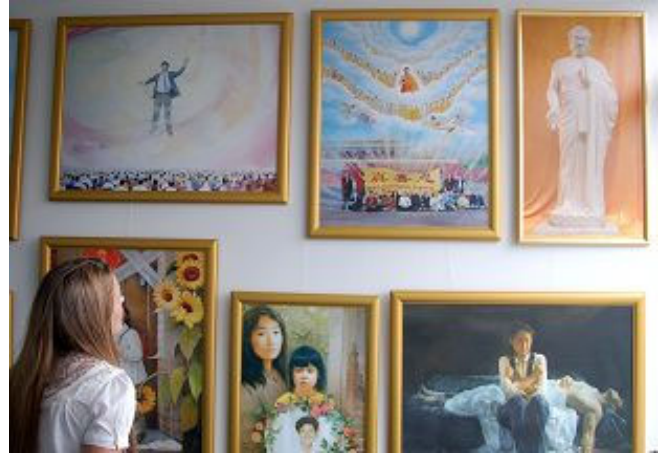
▲凝神观看画作的女孩

二零零八年七月二十三日至三十日，“真善忍美术画展”首次在丹麦哥本哈根举办。此次美展由丹麦法轮大法协会和丹麦北欧亚洲艺术协会联合主办，展出画作近二十幅。