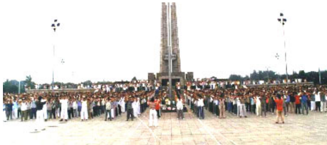
99年7.20以前唐山纪念碑广场集体炼功场面

法轮大法因其“真善忍”法理带给世界的美好，收到世界各国政府机构、议员、团体组织等对法轮大法和创始人的褒奖、支持议案和信函已超过2938项（至2007年12月）。创始人李洪志先生自2000年起连续四年被提名为诺贝尔和平奖候选人。