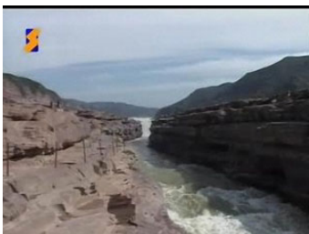
昔日的金黄色大瀑布变清了