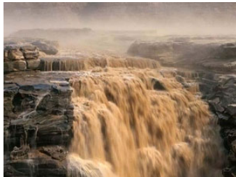
以前的黄河壶口瀑布

零八年真是非同寻常：雪灾、地震、手足口病、暴雨、沙尘暴、观音塘水短时间的消失殆尽、螃蟹上树等等灾难和异象都在警示着人们，灾祸在逼近我们。但同时，上天又让人们看到希望。六月份，黄河壶口的河水由黄变清似乎在告诉