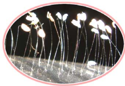
开在塑料杯上的优昙婆罗花

【明慧网】二零零八年五月十五日（农历四月十一），也就是法轮功学员们庆贺大法师父生日和世界法轮大法日的第三天，在湖北黄冈武穴市又出现优昙婆罗花。