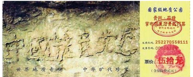
掌布河谷风景区门票，清晰可见的六个大字。

在中共灭亡前劝人“三退”（退出党、团、队），是因为他们看到世人面临的真实危险，告诉人们别给共产邪党当陪葬、逢凶化吉的好办法。“天灭中共，退党保命”，这是必然要发生的事实。