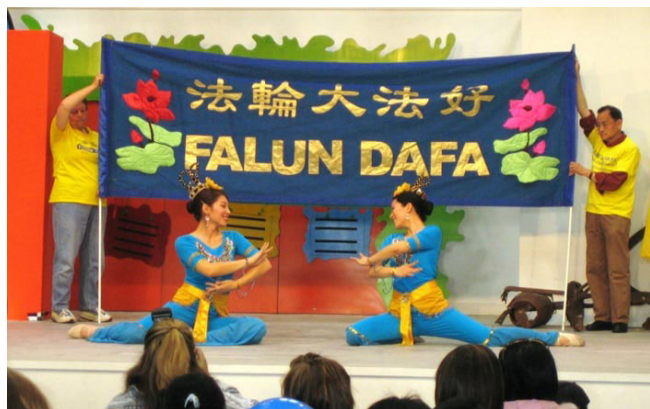
法轮功学员表演舞蹈“花仙”

【明慧网】澳洲昆士兰一年一度规模最为庞大的布里斯本皇家博览会于二零零八年八月登场。昆