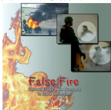
新唐人电视台制作的影片 《伪火》获第 51 届哥伦布 国际电影电视节荣誉奖

揭露自焚真相的影片《伪火》获奖, 中共颜面无光。国际教育发展组织于该年八月十四日在联合国会议上, 就天安门自焚事件, 强烈谴责中共当局的“国家恐怖主义行?”: 所谓“天安门自焚事件”是对法轮功的构陷, 涉及惊人的阴谋与谋杀。声明说: 从录影分析表明, 整个事件是“政府一手导演的”。