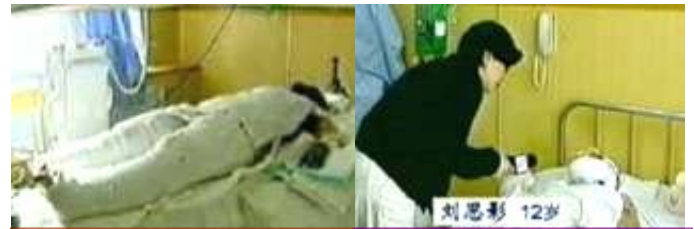
气管切开还能说唱? 记者采访不穿防护服不戴口罩。