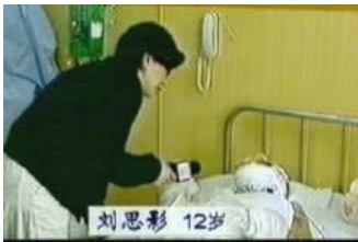
气管切开还能说、唱？记者采访不穿防护服，不戴口罩