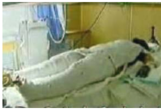
央视《焦点访谈》中的“自焚者”被包裹得严密。

上课的铃声响了，老师照旧夹着课本走进教室，在讲台上侃侃而谈起来，教学内容是上节的延续，同学们只是听着没有什么反应。此时老师话题一转说：“我们现在讲科学，相信科学，我看法轮功就不讲科学，……”