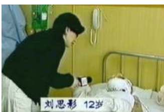
气管切开还能说、唱？记者采访不穿防护服，不戴口罩