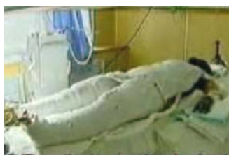
央视《焦点访谈》中的“自焚者”被包裹得严密。

慧的。有几个节目很动人。我本身没有经历过法轮功的事，从《觉醒》（表现修炼法轮功的母女遭到恶警迫害时，民众们挺身而出维护了正义）中看到他们受到的虐待，非常感动，感动得流泪。我也一直想听这几位歌唱家的演唱，今天终于大饱耳福。他们唱出了心中的信仰，是真实的感受，这是最重要的。‘神韵’到最后归结为纯真。我们做每件事，都需要诚实。”