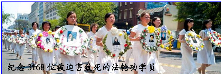
纪念 3168 位被迫害致死的法轮功学员