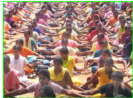
印度公立女子学校的校长组织全体一千两百名学生学炼法轮功。

【明慧网】在印度，现在已有至少三十几所学校的成千上万的师生在修炼法轮功。法轮功为什么在印度学校有这么大吸引力呢？仅来看看下面的一个