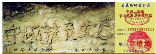
图为藏字石风景区门票。

校长若有所悟的哦了一声说：“怪不得法轮功那么神奇！我一直琢磨共产党历来整人立竿见影，唯独在法轮功面前虚弱无力，原来它面对的不是一般人呀！我总算明白了天为什么要灭中共！看了《九评》我知道共产党做尽了坏事，气数到了；现在看来它灭亡的真正原因是它镇压了法轮功。所以，2002年贵州平塘那块亿年藏字石亮出了‘中国共产党