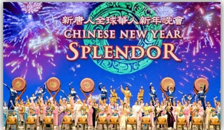
■ 2008 年神韵在纽约无线电城音乐厅演出的盛大场面

最后谢佩蓉说：“我们重视每场演出、每一位观众，希望每个观众都能真正了解神韵传递出的中华五千年文化精华，不要错过这个机缘。文化是一个民族的根。我们以祖先传下来的深厚文化而自豪，也为神韵能将这些宝贵的财富承传到未来而骄傲。”◇