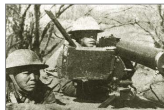
国军将士在台儿庄外围阻击进犯的日军

另外，中共大肆宣传的南泥湾“大生产运动”，实际上是非法种鸦片的运动。《九评》揭出了中共在陕北南泥湾种罂粟，张思德因烤制毒品被砸死这一史实。其实，种毒、制毒、贩毒的罪恶勾当在中共的各占领区蔓延普及，中共种植罂粟、制作毒品贩卖，换取经费以招兵买马，那是千真万确的事实。