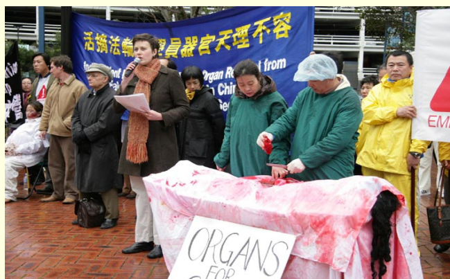
揭露中共活摘法轮功学员器官的模拟展示

【明慧网】八月十日，悉尼法轮功学员于第二十二届国际器官移植医生大会之际，在达令港的会展中心前召开新闻发布会，呼吁国际社会帮助制止中共活体摘取法轮功学员器官的罪行。