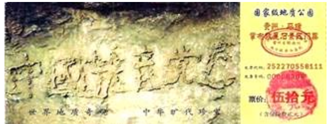
贵州省平塘县掌布乡风景区门票

二零零二年六月，在贵州省平塘县掌布乡发现了距今 2 亿 7 千万年的“藏字石”，五百年前崩裂的巨石断面内惊现六个排列整齐的大字“中国共产党亡”，其中那个“亡”字特别的大。中国的各路地质专家经实地考察后一致认为，这“藏字石”上未发现任何人工的痕迹，海内外一百多家报纸、电视、网站转发了这消息，“藏字石”的图片还被赫然印在贵州“藏字石”风景区的门票上(下图)。(在网上搜索“藏字石”即可见证！)