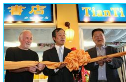
嘉宾为多伦多天梯书店剪彩

八月三十一日，加拿大多伦多最热闹的中区唐人街，新开张了一家非同一般的书店：天梯书店——法轮功书籍的专营店！这是在北美的又一家天梯书店。