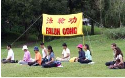
法轮功学员炼第五套功法

【明慧网】二零零八年八月十日，当看到在瑞典斯德哥尔摩著名的旅游景点瓦萨沉船博物馆（Vasa museet）旁集体炼功的法轮功学员时，一对来自中国大陆的老年夫妇感叹道：“真的是哪里都有法轮功啊！”