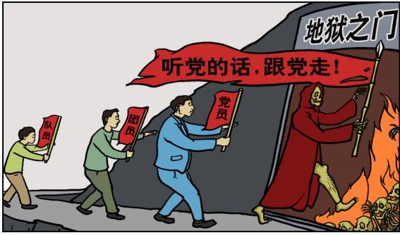
漫画：听党话 跟党走