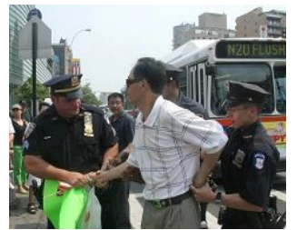
美国警察逮捕谩骂法轮功学员的中共暴徒。

美国 【明慧网】零八年五至六月，在中共政法委书记周永康的策划下，中共从国内到海外配合式构陷法轮功，继续制造谎言煽动中国民众和海外华人对法轮功的仇恨。在中领馆的幕后组织下，五月十七日，暴徒大规模骚扰和围攻纽约退党服务中心，并殴打退党服务中心员工。并在此后数日，在法拉盛的“九评”资料点连续发生严重恶性