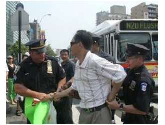
美国警察逮捕谩骂法轮功学员的中共暴徒。

美国【明慧网】 零八年五至六月，在中共政法委书记周永康的策划下，中共从国内到海外配合式构陷法轮功，继续制造谎言煽动中国民众和海外华人对法轮功的仇恨。在中领馆的幕后组织下，五月十七日，暴徒大规模骚扰和围攻纽约退党服务中心，并殴打退党服务中心员工。并在此后数日，在法拉盛的“九评”资料点连续发生严重恶性