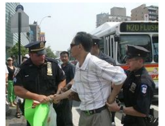
美国警察逮捕谩骂法轮功学员的中共暴徒。

美国【明慧网】 零八年五至六月，在中共政法委书记周永康的策划下，中共从国内到海外配合式构陷法轮功，继续制造谎言煽动中国民众和海外华人对法轮功的仇恨。在中领馆的幕后组织下，五月十七日，暴徒大规模骚扰和围攻纽约退党服务中心，并殴打退党服务中心员工。并在此后数日，在法拉盛的“九评”资料点连续发生严重恶性