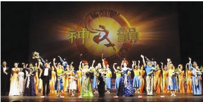
零零九年一月三日，神韵巡回艺术团在纽约布鲁克林音乐学院吉尔曼歌剧院向观众谢幕。

【明慧网二零零九年一月四日】（明慧记者黄美芬美国纽约布鲁克林报导）二零零九年一月三日晚，神韵巡回艺术团在美国纽约州布鲁克林市音乐学院吉尔曼歌剧院（BAM- Howard Gilman Opera House）展开第二场演出。其全美与至善的精神感动无数观众，除了让西方朋友认识惊叹中国神传文化结合艺术演出的美轮美奂之外，也让身处海外的中国人感到骄傲，因为神韵的艺术家诠释出的是真正的中国文化。