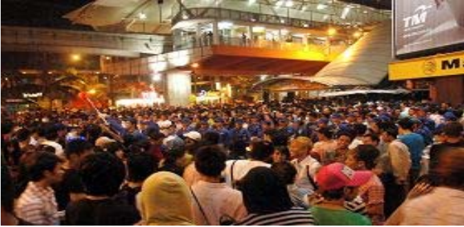
▲天国乐团在武吉免登区演奏，受到民众热烈欢迎。倒数过后，现场观众迟迟不愿离开。天国乐团继续为大家演奏。

【明慧网二零零九年一月一日】十二月三十一日，二零零八年的最后一天，马来西亚天国乐团来到首都吉隆坡黄金三角区的核心地带——武吉免登区，首次与民众一起倒数迎新，震撼了整个黄金三角区。