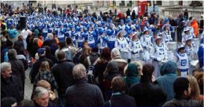
▲法轮功学员组成的欧洲天国乐团

【明慧网二零零九年一月四日】（明慧记者雪莉伦敦报道）二零零九年一月一日正午时分，第二十三届伦敦新年大游行于著名的国会广场前拉开序幕。来自全球二十个国家，九十二个团体