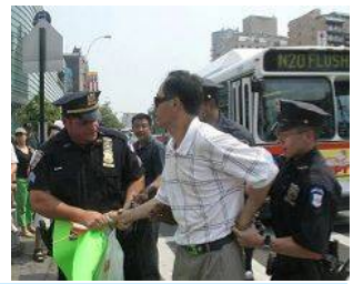
美國警察逮捕謾罵法輪功學員的中共暴徒。

美國 【明慧網】零八年五至六月，在中共政法委书记周永康的策划下，中共从国内到海外配合式构陷法轮功，继续制造谎言煽动中国民众和海外华人对法轮功的仇恨。在中领馆的幕后组织下，五月十七日，暴徒大规模骚扰和围攻纽约退党服务中心，并殴打退党服务中心员工。并在此后数日，在法拉盛的“九评”资料点连续发生严重恶性围攻和威胁工作人员的事件。之后中共新华网和央视国际将此事件谎编成“纽约华人为四川震灾募