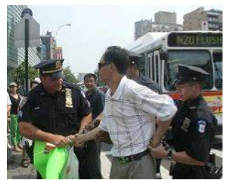
美國警察逮捕謾罵法輪功學員的中共暴徒。

美國 【明慧網】零八年五至六月，在中共政法委书记周永康的策划下，中共从国内到海外配合式构陷法轮功，继续制造谎言煽动中国民众和海外华人对法轮功的仇恨。在中领馆的幕后组织下，五月十七日，暴徒大规模骚扰和围攻纽约退党服务中心，并殴打退党服务中心员工。并在此后数日，在法拉盛的“九评”资料点连续发生严重恶性围攻和威胁工作人员的事件。之后中共新华网和央视国际将此事件谎编成“纽约华人为四川震灾募