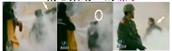
1.刘头部受重击 2.击打后飞出的重物 3.打击者仍保持用力姿势

如果把中央电视台——CCTV《焦点访谈》提供的录像镜头放慢可以看见，被官方媒体称为自焚而死的