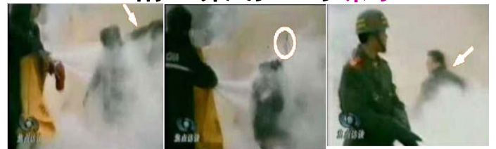
1.刘头部受重击 2.击打后飞出的重物 3.打击者仍保持用力姿势

如果把中央电视台——CCTV《焦点访谈》提供的录像镜头放慢可以看见，被官方媒体称为自焚而死的