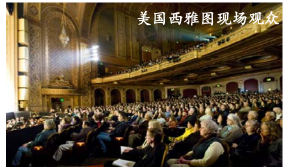
美国西雅图现场观众

“神韵、神韵哪，我一直不知道神韵含义在哪儿，现在开始理解了，她的‘韵’就是‘真、善、忍’，这个韵是谁能够感受到，谁就能跟着神一起回家。”◇