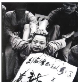
“文革”中典型的百姓斗百姓的场面

比如“文革”时被打倒的对象——所谓的地、富、反、坏、右、叛徒、特务、走资派、臭老九。现在看来，那些人都是普通的善良百姓，由于中共政治斗争的需要，把他们描绘成坏人、魔鬼，又给百姓灌输“阶级敌人”是被专制的对象在长期的灌输中，人们失去了独立思考的能力，因此出现了人类历史上罕见的父子相残、夫妻反目、酷刑、杀戮的文革时代。其实“仁、义、礼、智、信”，才是国人为人的根本、齐家治国平天下的所依啊！