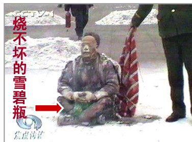
中共导演“自焚伪案”，煽动民众仇恨，为迫害法轮功制造借口

只有了解能化解误解。古语说：“兼听则明，偏听则暗。”真相能揭开谜团，为我们辨别方向。所以，不要关上这扇通往光明的真相之门。如果文革中被迫害的人都能站起来，澄清事实真相，那么你死我活的