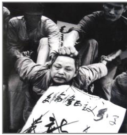
“文革”中典型的百姓斗百姓的场面

比如“文革”时被打倒的对象——所谓的地、富、反、坏、右、叛徒、特务、走资派、臭老九。现在看来，那些人都是普通的善良百姓，由于中共政治斗争的需要，把他们描绘成坏人、魔鬼，又给百姓灌输“阶级敌人”是被专制的对象在长期的灌输中，人们失去了独立思考的能力，因此出现了人类历史上罕见的父子相残、夫妻反目、酷刑、杀戮的文革时代。其实“仁、义、礼、智、信”，才是国人为人的根本、齐家治国平天下的所依啊！