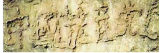
贵州平塘 县内巨石 崩裂后自 然形成六 个大字

现在奇书《九评共产党》引发的三退大潮（已经有超过 4884 万人声明退出党、团、队）绝非偶然，贵州的藏字石早将天意昭示世人，一个又一个的天灾都在向我们预警，让人赶快离开中共邪党这条贼船。所以你用小名、化名都可以，因为上天看人心。只要不声明退出就是它的一分子，毒誓就会生效，在天灭中共时谁也救不了你呀！我最亲爱的中国父老乡亲们，请倾听慈悲的呼唤，请赶快退出党、团、队等一切中共邪党的组织吧！千万莫迟疑啊！◇