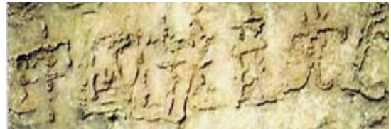
贵州平塘 县内巨石 崩裂后自 然形成六 个大字

现在奇书《九评共产党》引发的三退大潮（已经有超过 4884 万人声明退出党、团、队）绝非偶然，贵州的藏字石早将天意昭示世人，一个又一个的天灾都在向我们预警，让人赶快离开中共邪党这条贼船。所以你用小名、化名都可以，因为上天看人心。只要不声明退出就是它的一分子，毒誓就会生效，在天灭中共时谁也救不了你呀！我最亲爱的中国父老乡亲们，请倾听慈悲的呼唤，请赶快退出党、团、队等一切中共邪党的组织吧！千万莫迟疑啊！◇