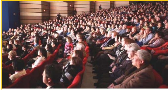
一月十日神韵纽约艺术团在加拿大多伦多的演出爆满

夫·伍德沃兹说：“我期盼神韵很久了，我虽然看了无数演出，可今天的晚会最为壮丽、多彩，这些动人的音乐最令人愉悦！”他表示神韵的美好远远超出自己的预期。